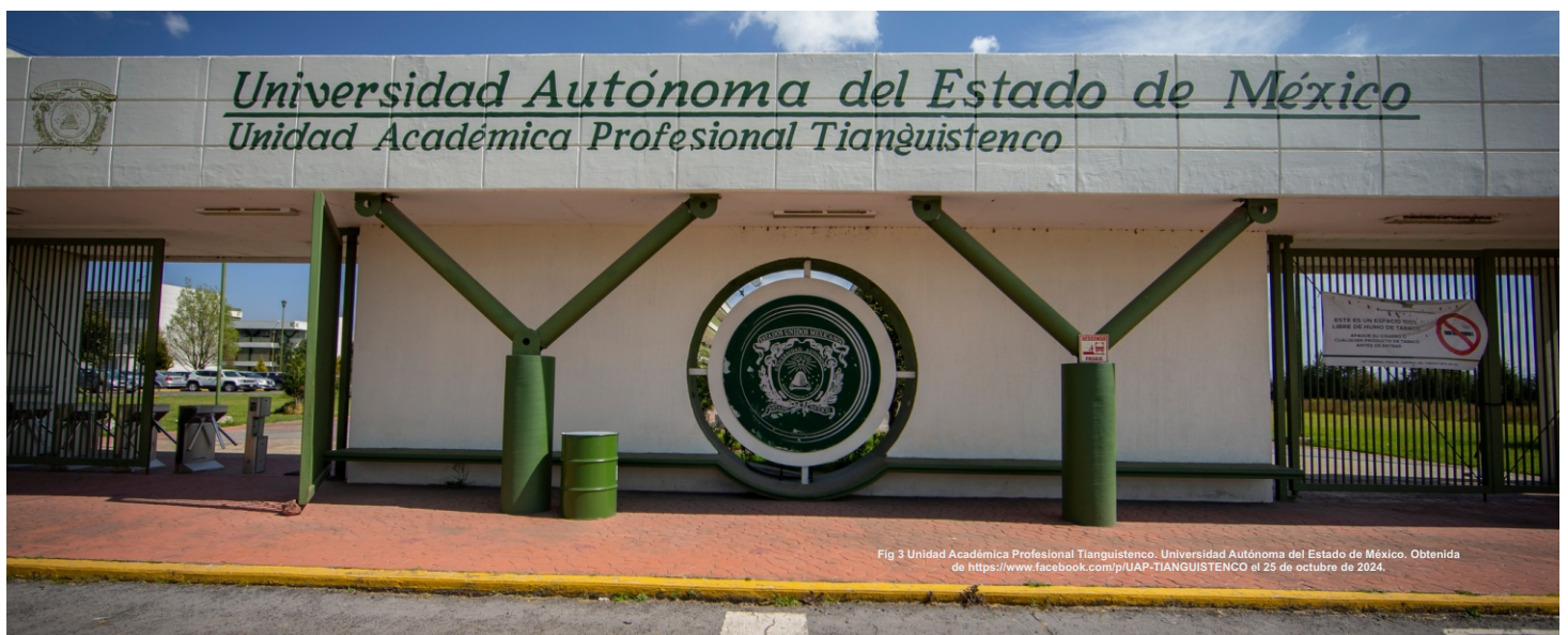
Fig 3 Unidad Académica Profesional Tianguistenco. Universidad Autónoma del Estado de México.

Todo lo descrito con anterioridad es el fruto del trabajo de los que orgullosamente formamos parte de la UAP Tianguistenco, en la que, a pesar de nuestras diferencias ideológicas y deficiencias de infraestructura (las cuales son cada vez mayores), nos identificamos como una gran familia siempre unida en los momentos más difíciles.