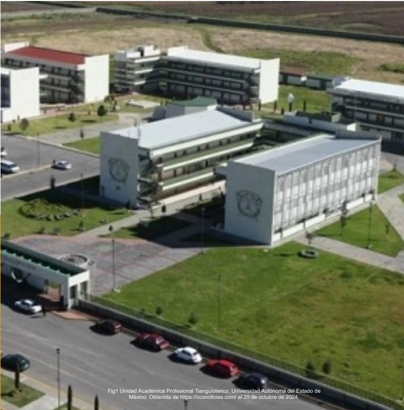
Fig1 Unidad Académica Profesional Tianguistenco. Universidad Autónoma del Estado de México. Obtenida de https://conoticias.com/ el 25 de octubre de 2024.