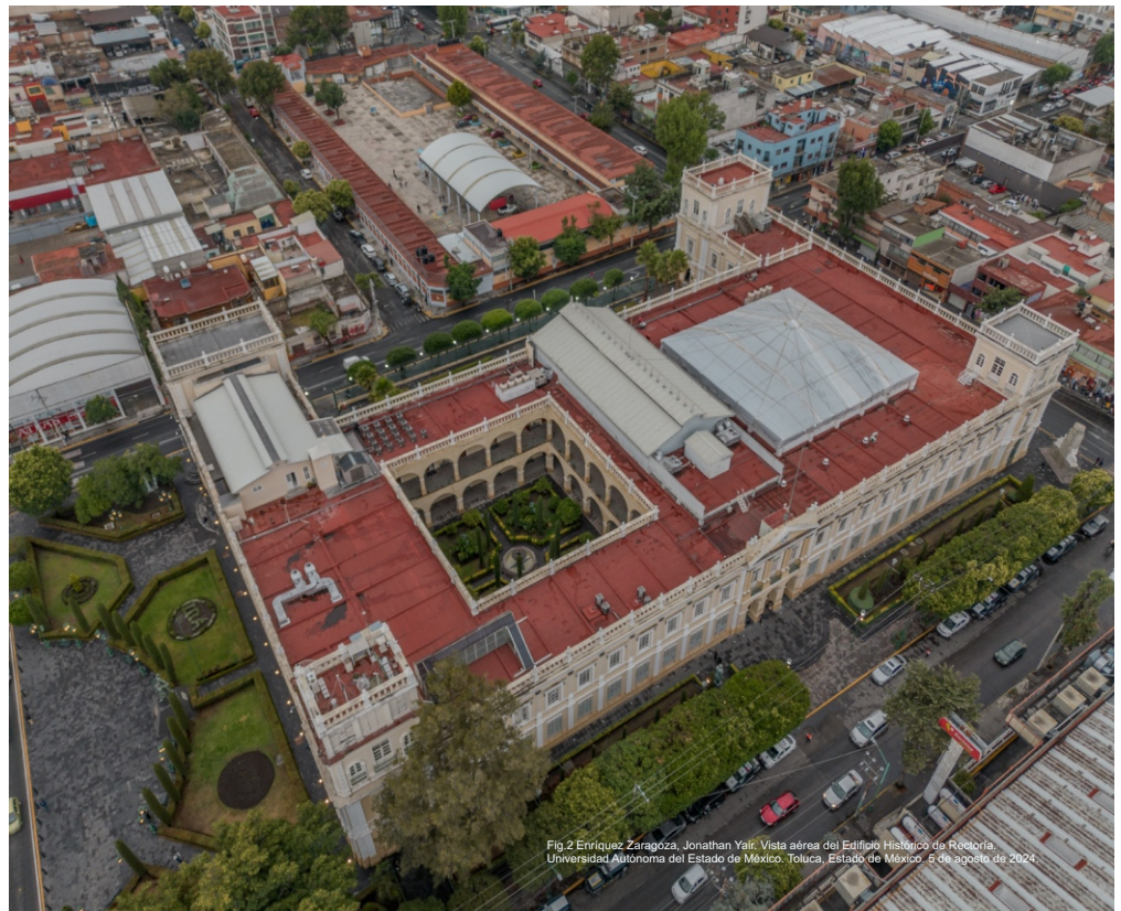
Fig. 2 Enriquez Zaragoza, Jonathan Yair. Vista aérea del Edificio Histórico de Toluca. Universidad Autónoma del Estado de México. Toluca, Estado de México. 6 de agosto de 2024

En su primera etapa, el Doctorado estaba conformado por diversas Unidades de Aprendizaje (UA) integradas como se describirá a continuación. (1) Básica: corresponde a las UA que son comunes a todos los estudiantes; se ubican en los dos primeros semestres; proporcionan el sustento teórico, epistemológico, metodológico y empírico del estudio sobre el desarrollo humano (24 créditos). (2) Disciplinar: son UA que corresponden al enfoque disciplinario que se elija; se ubican en el segundo y tercer semestre; su importancia reside en que proporcionan la especificidad disciplinaria y aportan elementos teóricos para el desarrollo de la investigación de tesis de